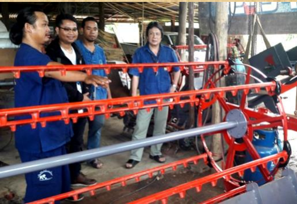
ซ่อมบำรุงและเทคโนโลยีทางการเกษตร