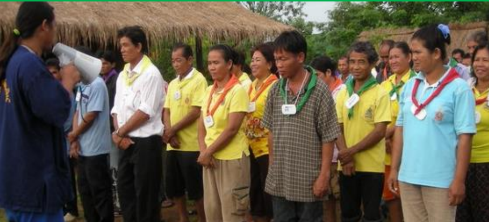
ฝึกอบบรมเครือข่ายเกษตรกรและนักเรียน