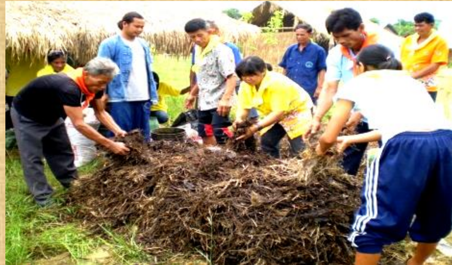
ละ ลด เลิก ใช้ปุ๋ยเคมี ยาฆ่าหญ้า เฝ้าฟาง