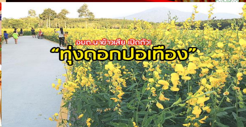
อบต.นาข้าวเสีย เปิดตัว! "ทุ่งดอกปอเทือง"