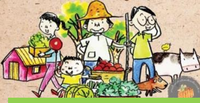
ตลาดชุมชนและรถพุ่มพวงสุขภาพ

ผัก-ผลไม้ สำหรับสาย Healthy อร่อยได้ ประโยชน์ครบ ที่ Gourmet Market