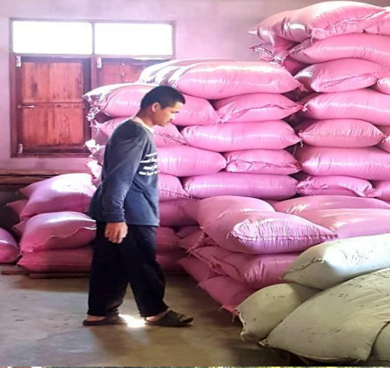
จำหน่ายพันธุ์ข้าวสมาชิก