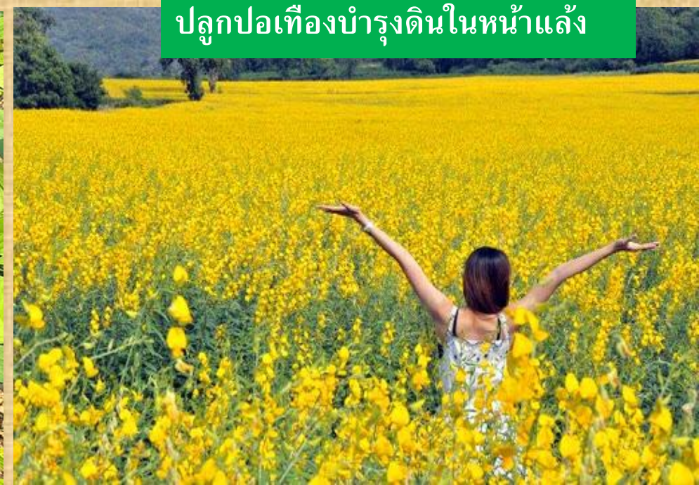
ปลูกปอเทืองบำรุงดินในหน้าแล้ง