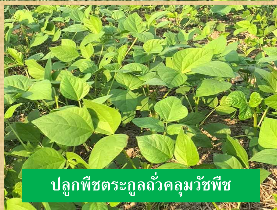
ปลุกพืชตระกูลถั่วคลุมวัชพืช