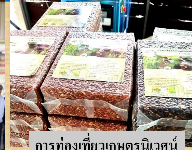
การท่องเที่ยวเกษตรนิเวศน์