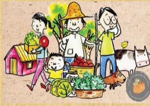
การตลาดในชุมชน