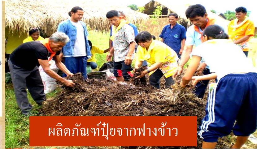
ผลิตภัณฑ์ปุ๋ยจากฟางข้าว